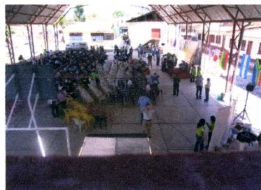
カナラビという街に移動、表彰式会場です

審査会では、世界各国の審査員との交流も楽しいものです。 また、このプログラムで重要なのが生産者との交流です。生産者の生の声を聞く事、そして我々との意見交換はより良きコーヒーづくりに活かされて行きます。それにしても...とても純朴な方々です。