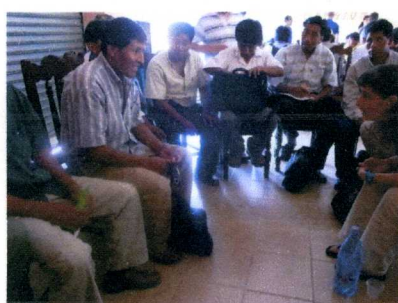
生産者との意見交換や質疑応答 コーヒーの評価について...

審査会では、世界各国の審査員との交流も楽しいものです。 また、このプログラムで重要なのが生産者との交流です。生産者の生の声を聞く事、そして我々との意見交換はより良きコーヒーづくりに活かされて行きます。それにしても...とても純朴な方々です。