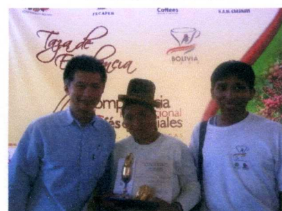
中央が見事 1 位の栄冠に輝いた生産者