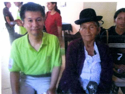
生産者とのミーティング 7 月にも訪問した農園の名物おかあさん