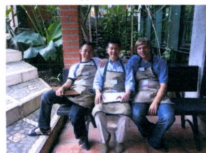
リトアニア&カナダのカッパーと 英語?...スマイルで会話してます