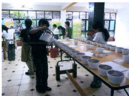
20 数名の審査員でカップング 1 回のセッションで 10 カップを数セッション