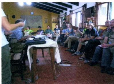
セッション毎に内容のディスカッション 特長を詳細に吟味します