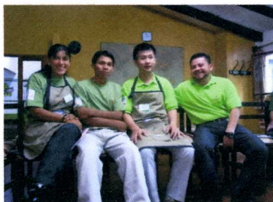
審査の合間に記念撮影、 ボリビア&ホンジュラスのカッパーと