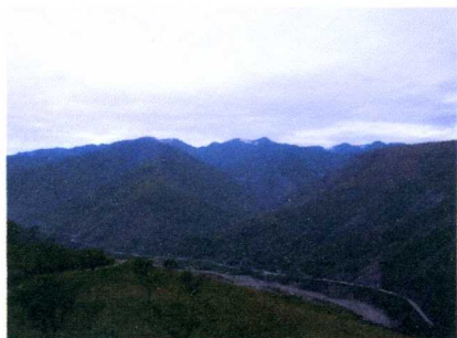
標高 4000M のラパスから 1600M のコロイコという街の審査会場へ

2008年10月7日～11日 ボリビア COE カップオブエクセレンスの審査会に国際審査員として参加しました。カップオブエクセレンスとは、コーヒー豆の品評会としては世界で一番権威があるといわれ、現在は9カ国の国毎に審査を重ねられ、COE 審査フォームにより100点満点で84点以上のロットのみに、カップオブエクセレンスの称号が与えられています。その品質は極めて評価が高くインターネットオークションで世界の業者と取引される入賞豆はスペシャルティコーヒーの最高峰として世界のコーヒーファンに愛飲されています。また、その代金は殆ど生産者に直接支払われ、更なる品質向上の為の設備投資などに向けられています。この品評会自体がフェアトレードも含めた品質向上のプログラムとして評価される由縁です。