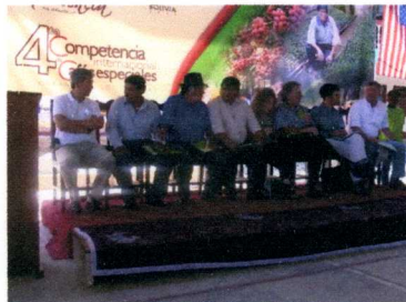
主催者、来賓も登壇...