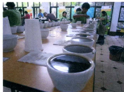
一次、二次審査、そして最終の ベスト 10 審査と進められます